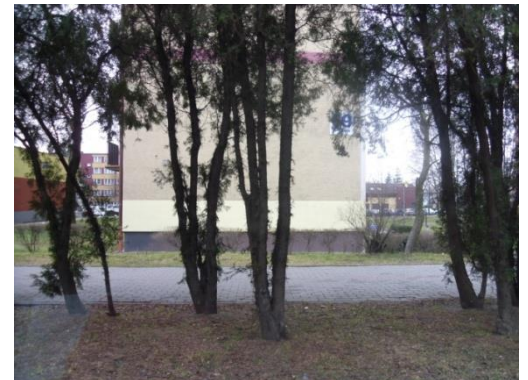
ul. Lwowska 69