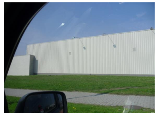
Al. Jana Pawła II