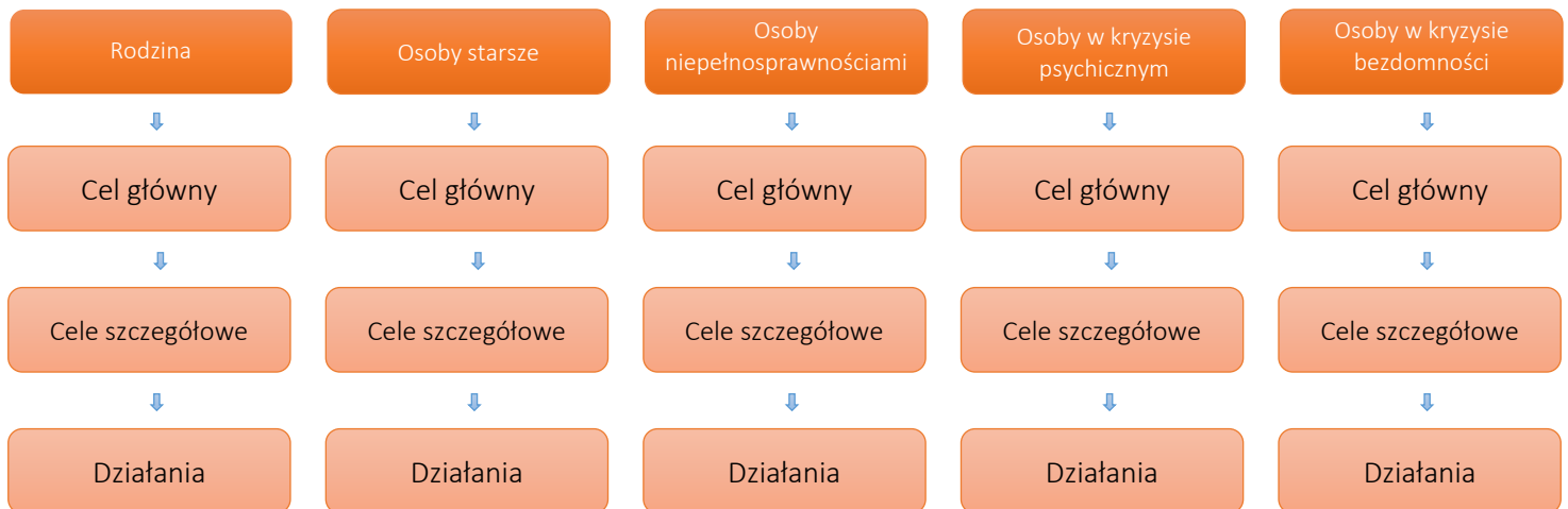
Schemat 1 Drzewo celów i działań Planu

Poniżej prezentowany jest schemat ww. drzewa.