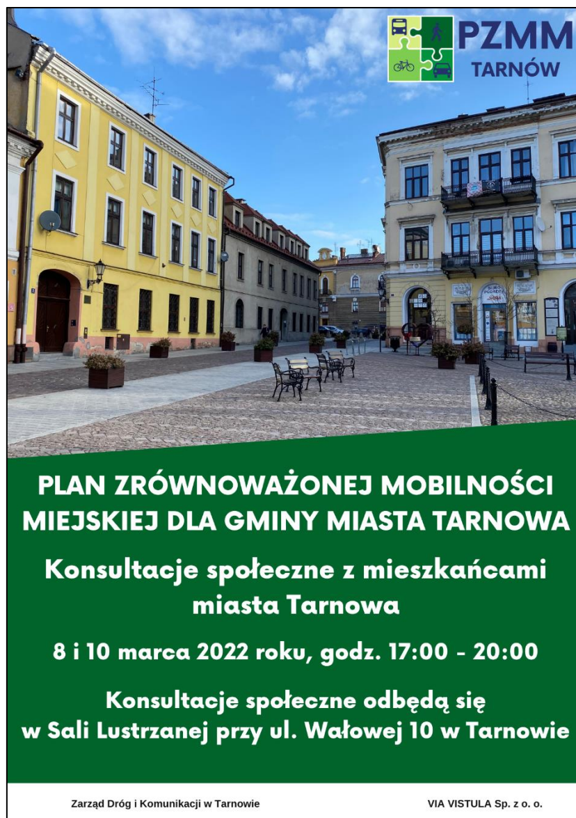
Rysunek 2 Jeden z plakatów informujących o realizowanych konsultacjach dokumentu

Istotność uczestnictwa mieszkańców w działaniach związanych z planem była istotna od samego początku opracowywania dokumentu, dlatego na potrzeby projektu stworzono logo będące elementem identyfikacji wizualnej projektu. Dodatkowo skupiono się na informowaniu mieszkańców o działaniach i projekcie w środkach masowego przekazu, w tym głównie w kanałach informacyjnych on-line, z wykorzystaniem platformy Facebook® oraz stron internetowych Tarnowa www.tarnow.pl .