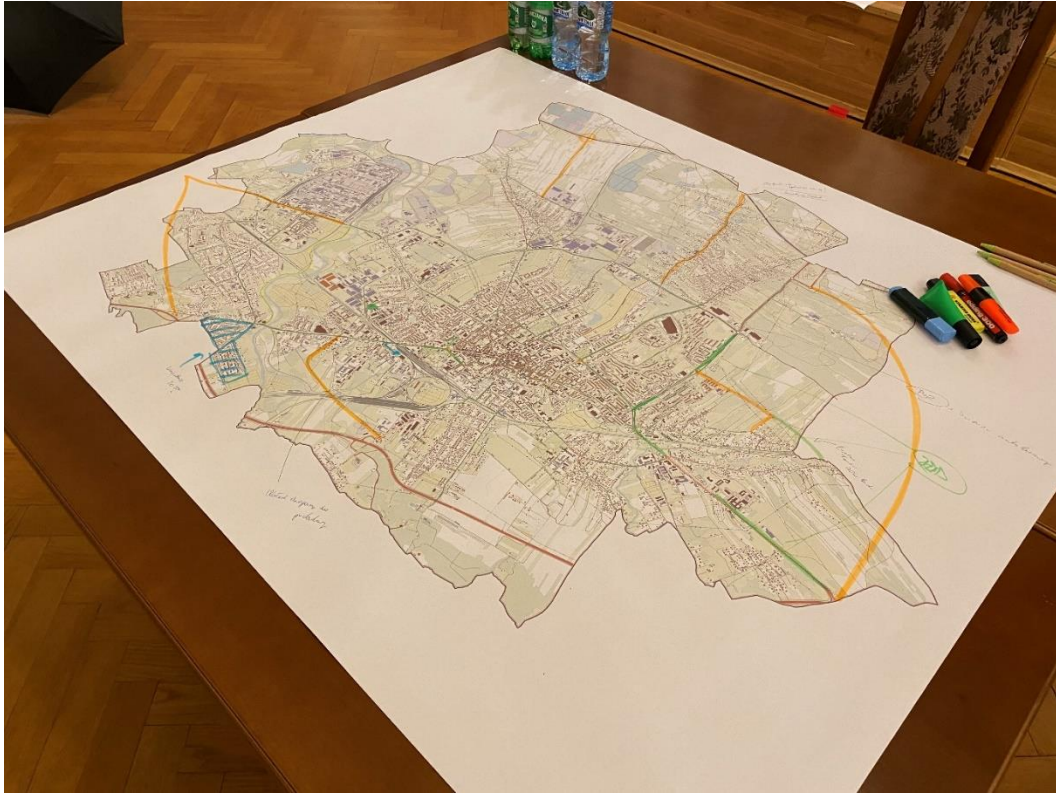
Zdjęcie 1 Mapa Tarnowa z wrysowanymi propozycjami zmian w przestrzeni miejskiej