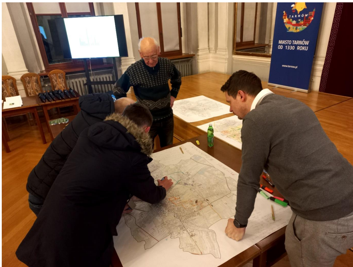
Zdjęcie 4 Dyskusja w ramach warsztatów społecznych