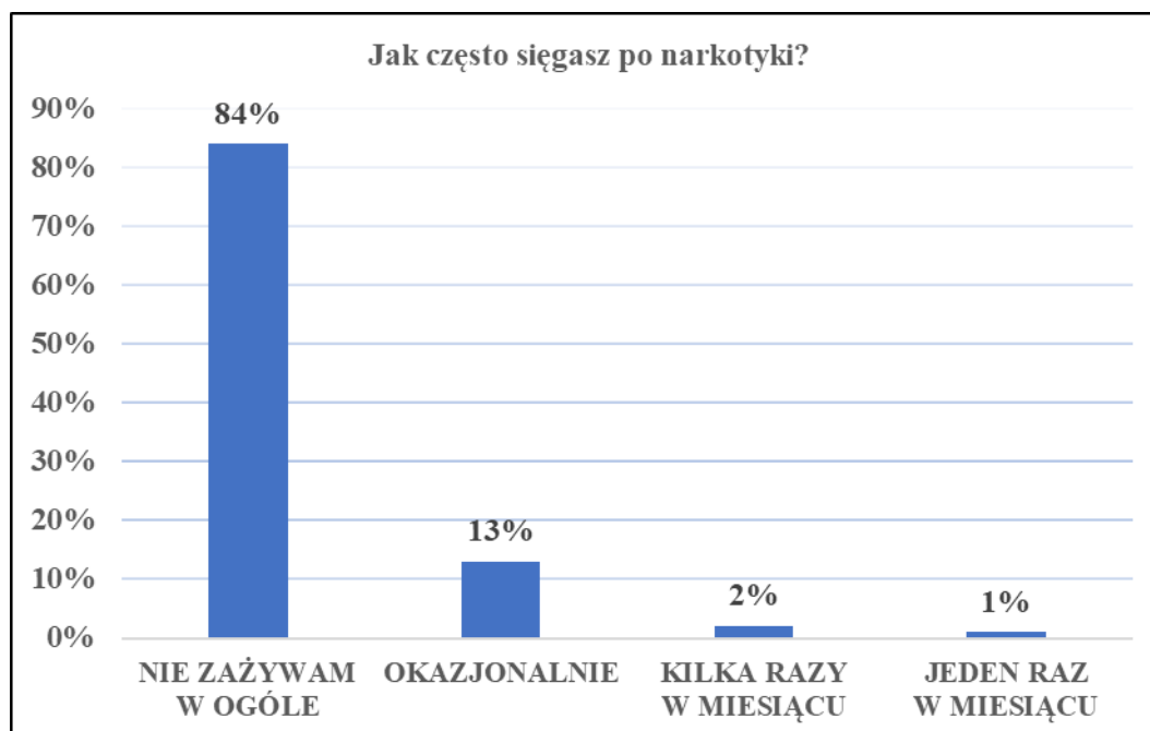
Tabela nr 3: Częstotliwość zażywania narkotyków przez tarnowską młodzież